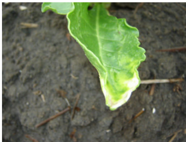
Object 9: verkleuring door Centium.

Na deze beoordeling waren er geen standsverschillen meer te zien. Alleen in object 9 was er nog lange tijd een wit verkleuring van de bladeren te zien.