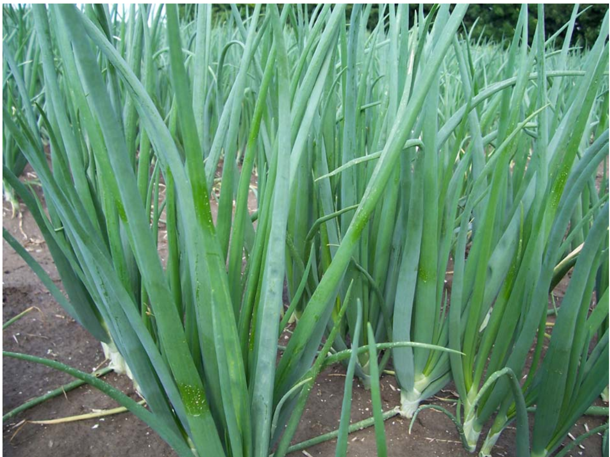
Foto: aantasting van de waslaag in object 10.

Op 05-07 en 11-07 is bij ca. 50% van de pijpjes in object 10 een donkerverkleuring zichtbaar van ca. 2 cm. (waslaag is hier weg). Op 03-08 is ca. 20% van de waslaag aangetast in dit object.